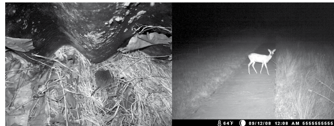
Bij het controleren van de slangenplaten is 6 keer een woelmuis waargenomen en 6 keer een spitsmuis. De dieren maakten zich meestal razendsnel uit de voeten, maar deze Rosse woelmuis kon nog net op foto vastgelegd worden. 16 juli 2008.