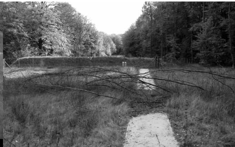
Zicht op het zandbed vanuit het noorden, van op de stobbenwal. 22 oktober 2008.

De onverlichte en niet al te brede Naamsesteenweg is voor de meeste vleurmuizen geen barrière, dit in tegenstelling tot een verlichte snelweg. De meeste dieren gebruiken de bosrand en het ecoduct dan ook eerder als foeragegebied.