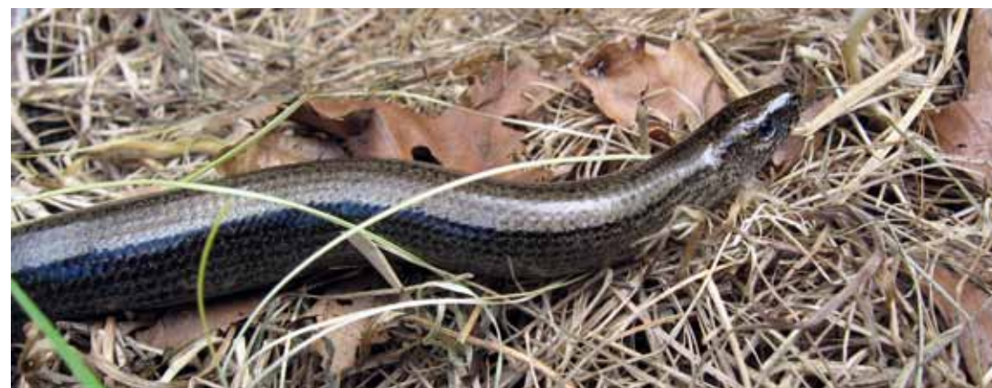
Een Hazelworm op 4 augustus 2008 onder een slangenplaat op het ecoduct Warande.

Amfibieën en reptielen (herpetofauna) zijn zeer gevoelig voor versnippering van hun leefgebieden door wegen. Het is vooral voor deze diergroepen dat