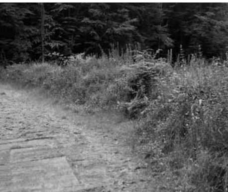
Zicht op het ruiterspad, waarop ook een strook zand wordt gladgestreken dat dient als 'zandbed' om sporen op te volgen. De weelderig begroeide stobbenwal scheidt het ruiterspad van het 'faunadeel' van het ecoduct. Foto op 17 juli 2008 vanuit het westen.