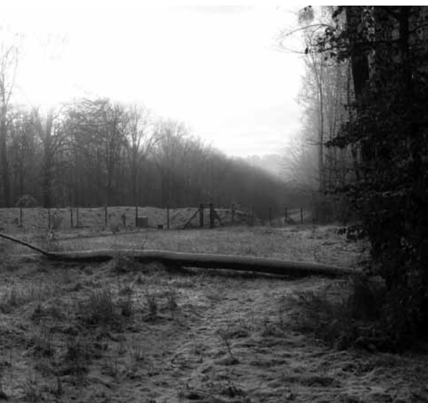
Sfeerfoto van het ecoduct op 25 november 2008, genomen vanuit het noordwesten.

Hierbij dient opgemerkt dat de zogenaamde 'slangenplaten' een nieuw gebruikte methodiek was in 2008 (dus niet toegepast in 2006). Het betreffen donkergroene, golvende platen van ca. een halve meter bij een halve meter (cfr. Donker 2001). Er zijn er 16 uitgelegd, in 4 raaien, verspreid over het ecoduct. Het gebruik van de Moultrie-fotovallen viel buiten de opzet van deze studie, maar is uitgevoerd als test van de werking van deze methode die in Nederland al zeer boeiende resultaten opleverde (ontdekking Wilde kat cfr. Mulder 2007).