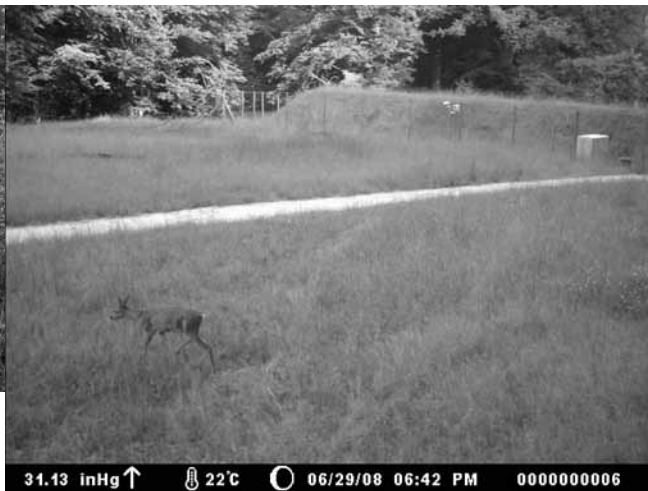
Een Ree die het ecoduct oversteekt van west naar oost op 29 juni 2008 ('s morgens om 06u42), is 'geflits' door een zogenaamde 'Moultrie fotoval'.