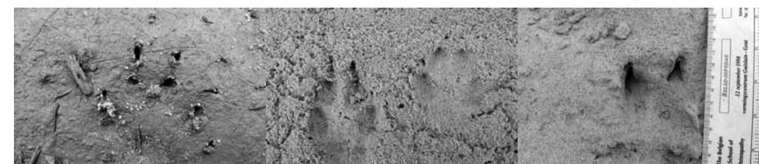
Prent van Steenmarter op een natte plek op het ruiterspad op 5 augustus 2008. Afdruk van de vijf teenkussens zichtbaar, evenals duidelijke nagelafdrukken. Typisch voor marters is de hoefijzervorm van de afdruk van het middenvoetkussen. Het sporenonderzoek in 2008 wees op frequente aanwezigheid van de Steenmarter.